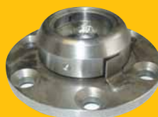
Uložení teleskopického zvedáku zn. LIAZ (horní) 650,- Kč + DPH