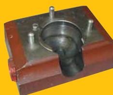
Uložení teleskopického zvedáku zn. LIAZ (dolní) 2 563,- Kč + DPH