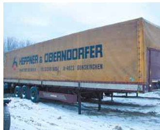
cen. kategorie I.

METACO návěs valník, r.v.2000 34 palet, třístranná shrn.plachta, zved.náprava, nápravy BPW, zadní vrata, kotouč.brzdy, měchy, užit.hm.26.7t, lož.výš.2.79m Možnost pronájmu s následným odkupem.