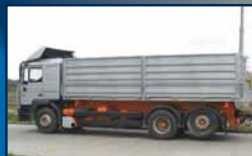
MAN 26414 3str. sklápěč, 26t