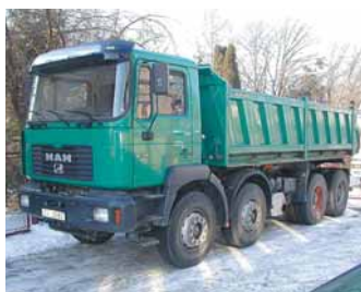
cena 2 070 000,- bez DPH

MAN 35.414 VFAK 8x8 sklápěč S3, r.v.2000 410 PS, 138.000km, klima, centr.mazání, půlená ocel.korba Meiller, 1 lůžko, list.péra, závěs, tempomat, užit.hm.16t Možnost pronájmu s následným odkupem.