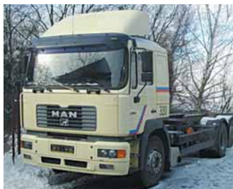
cen. kategorie IV.

MAN 26.414 FNLLW podvozek BDF, r.v.2000, 410 PS, 6x2, 196.000km, nízká kabina, klima, zved.náprava, centr.mazání, měchy, 2 lůžka, střeš.spojler, užit.hm.16.5t Možnost pronájmu s následným odkupem.