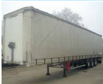
cena 450 000,- bez DPH

VOLVO FL 6 valník + HČ, r. v. 1999 180 PS, 302.000km, plachta, spací kabina, 1 lůžko, nez.topení, vyrovnaní k rampě, ABS, užit.hm.2.72t, lož.dl.6m, lož.výš.2.3m Možnost pronájmu s následným odkupem.