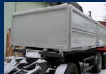
Přívěs šedý PANAV 22.16 nápravy, cena 429.000,- Kč bez DPH, Leasing možný.