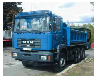
cena 1 890 000,- bez DPH

MAN 27.414 DFAK 6x6 sklápěč S3, r.v.2002 EURO 3, 80.000km, klima, centr.mazání, ocel.korba Meiller, závěs pr.50mm, list.péra, užit.hm.13.3t Možnost pronájmu s následným odkupem.