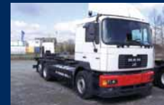
2 x MAN, 26.364 FNNLLW 6x2, 26.414 TNNLLW 6x2 – vozidla k dostavbě, cena dohodou