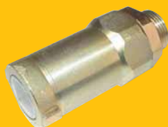
Rychlospojka 128,50 Kč + DPH