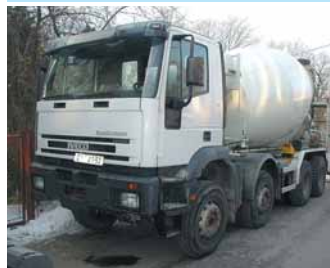
cena 1 880 000,- bez DPH

MAN 26.414 FNLLW podvozek BDF, r.v.2000, 410 PS, 6x2, 260.000km, nízká kabina, klima, zved.náprava, centr.mazání, měchy, 2 lůžka, střeš.spojler, užit.hm. 16.5t Možnost pronájmu s následným odkupem.