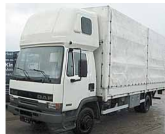
cena 580 000,- bez DPH

IVECO 340 E 35 HB - MIX, r.v.2001, EURO 3, 8x4, 350 PS, 105.000km, nástavba LIEBHERR HTM 904 - 9m3, list.péra, tempomat, užit.hm.18t Možnost pronájmu s následným odkupem.