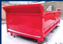
Tatra 815 S2, 99 900,- Kč bez DPH