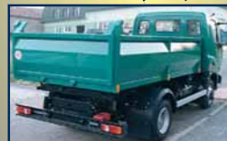
Avia Daewoo, damper