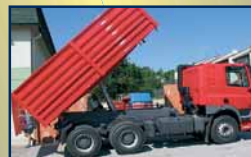
DAF cs, červený sklápěč