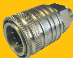
Rychlospojka RK 12,5 zásuvka M22x1,5 264,- Kč + DPH