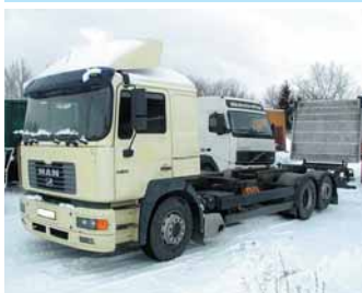
cen. kategorie IV.

MAN 27.414 DFK 6x4 sklápěč S3, r.v.2000, EURO 3, 410 PS, 121.000km, klima, centr.mazání, ocel. korba Meiller, tempomat, list.péra, závěs pr. 50mm, užit.hm.14.3t Možnost pronájmu s následným odkupem.