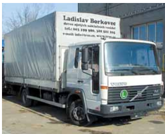
cena 480 000,- bez DPH

DAF 45.180 valník + HČ, r.v.2000, 180 PS, 309.000km, spací nástavba, plachta, nez.topení, list.péra, závěs pr.40mm, užit.hm.5.3t, HČ Behrens Možnost pronájmu s následným odkupem.