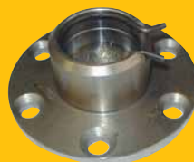
Uložení teleskopického zvedáku na vlek (horní) 438,- Kč + DPH