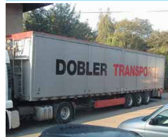
cen. kategorie IV.

HANGLER návěs valník, r.v.1993 34 palet, shrnovací plachta, nápravy BPW, mulda na svítky, měchy, ABS, užit.hm.26.8t, lož.výš.2.54m Možnost pronájmu s následným odkupem.