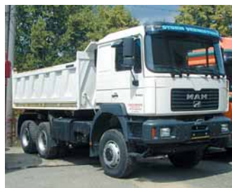
cena 2 230 000,- bez DPH

MAN 32.414 VFK 8x4 sklápěč S3, r.v.2000 410 PS, 131.000km, klima, centr.mazání, půlená ocel.korba Meiller, závěs pr.50mm, list.péra, užit.hm.18.1t Možnost pronájmu s následným odkupem.