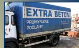
AVIA - nástavba - ALU valník s plachtou rozměry: d. 4520 š. 2220 v. 2050 šasi pozink - cena dohodou