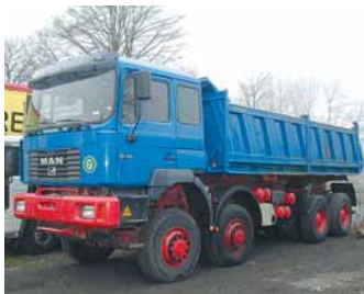
cen. kategorie VIII.

MAN 35.414 VFAK 8x8 sklápěč S3, r.v.2000 410 PS, 138.000km, klima, centr.mazání, půlená ocel.korba Meiller, 1 lůžko, list.péra, závěs, tempomat, užit.hm.16t Možnost pronájmu s následným odkupem.