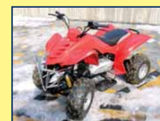
Čtyřkolka PIAGGIO, cena dohodou.

VÝKUP SKLÁPĚČÍCH AUTOVLEKŮ BSS 17.13, 16.12 – rovněž vykupujeme samotné technické průkazy