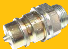
Rychlospojka RK 12,5 zástrčka M22x1,5 156,- Kč + DPH