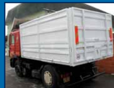
MAN 19-402 tahač přestavba sklápěč