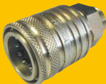
Rychlospojka ISO 12,5 zásuvka M22x1,5 242,- Kč + DPH