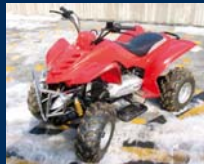
Čtyřkolka PIAGGIO, cena dohodou.