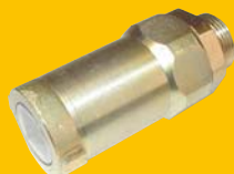
Rychlospojka RK 12,5 zástrčka M22x1,5 156,- Kč + DPH