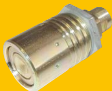
Rychlospojka RK 12,5 zásuvka M22x1,5 264,- Kč + DPH