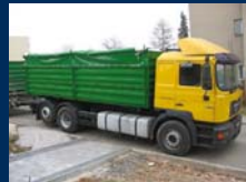
MAN 6 x 2, sklápěč, nová nástavba, prodej na tel. čísle: 603 802 280