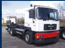
2 x MAN, 26.364 FNLLW 6x2, 26.414 TNLLW 6x2 – vozidla k dostavbě, cena dohodou