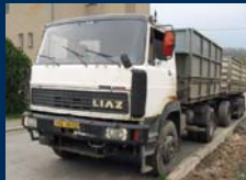
Liaz 150.261, r.v. 93, nová korba, cena dohodou.