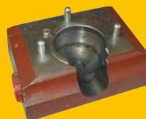
Uložení teleskopického zvedáku zn. LIAZ (dolní) 2 860,- Kč + DPH