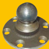
Uložení teleskopického zvedáku na vlek (spodní) 363,- Kč + DPH